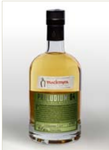
PRELUDIUM:04 - GRUVLAGRAD ELEGANS

SILVERMEDALJ IWSC, INTERNATIONAL WINE & SPIRIT COMPETITION 2007