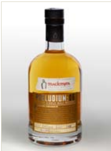
PRELUDIUM:06 - FRISK SVENSK RÖK

SILVERMEDALJ (BÄSTA UNGA WORLD WIDE WHISKY UPP TILL 8 ÅR) STOCKHOLM BEER & WHISKY FESTIVAL 2007