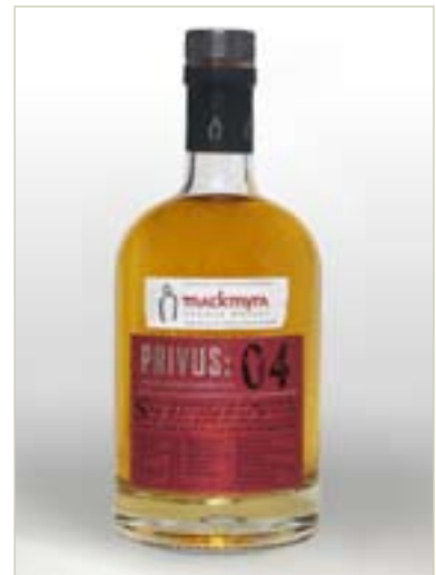
PRIVUS:04 - RÄTTA VIRKET

EUROPEAN MAINLAND WHISKY OF THE YEAR JIM MURRAY'S WHISKY BIBLE 2008