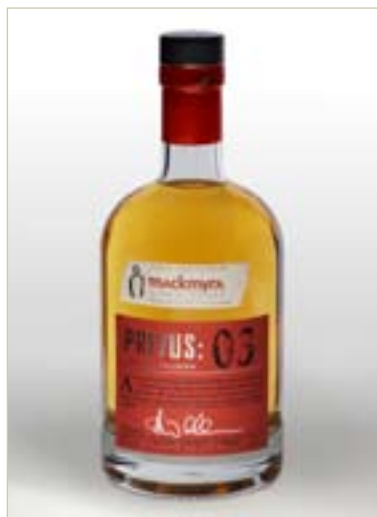
PRIVUS:03 - RÖKNING TILLÄTEN

ANDRA PRIS "HELMALTSWHISKY UNDER 10 ÅR (FRÅN ALLA LÄNDER)" WHISKYMÄSSAN "SMÅK AV WHISKY 2008" MALMÖ