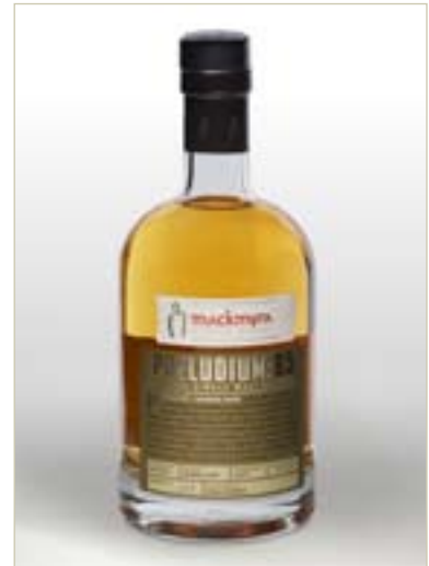
PRELUDIUM:05 - SMAKRIKA SMÅFAT

GULDMEDALJ (BÄSTA UNGA WORLD WIDE WHISKY UPP TILL 8 ÅR) STOCKHOLM BEER & WHISKY FESTIVAL 2007 SUPERIOR TASTE AWARD, 1 STAR INTERNATIONAL TASTE & QUALITY INSTITUTE, BRUSSELS SILVERMEDALJ IWSC, INTERNATIONAL WINE & SPIRIT COMPETITION 2007